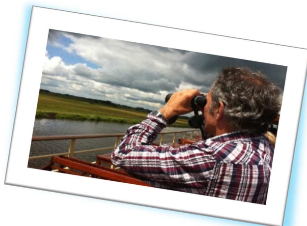
De Vecht is een aantrekkelijke rivier voor waterrecreatie in allerlei vormen.