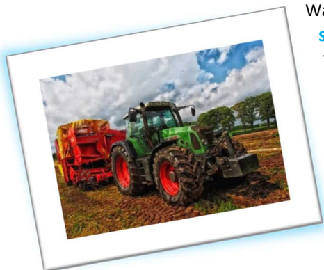
Klimaatverandering biedt de agrarische sector ook kansen.

Water Natuurlijk wil dat het waterschap meedenkt met de agrarische sector om de klimaatveranderingen op een duurzame manier het hoofd te bieden en de kansen ervan te benutten.