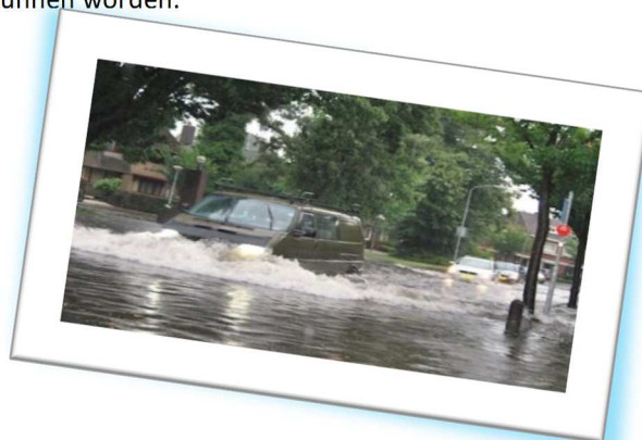
Straten die blank staan: het is niet altijd te voorkomen, maar bewoners kunnen zelf veel doen om het probleem te verminderen.