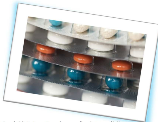
De vergrijzing leidt tot grotere hoeveelheden medicijnresten in het water, die alleen met heel dure technieken eruit te halen zijn.