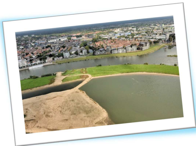
We maken meer ruimte voor het water van de IJssel.

Nederland wordt warmer en natter. De zee komt een stuk hoger, de rivieren krijgen meer water te verwerken en er valt meer regen in korte tijd. Klimaatverandering heeft daarmee een grote invloed op de veiligheid van de inwoners van Groot Salland. Veiligheid blijft daarom een hoge prioriteit. Gelukkig gaat dat meestal heel goed samen met mooier en leuker, met aandacht voor het landschap en natuur, met recreatiemogelijkheden en met behoud van cultuurhistorisch erfgoed.