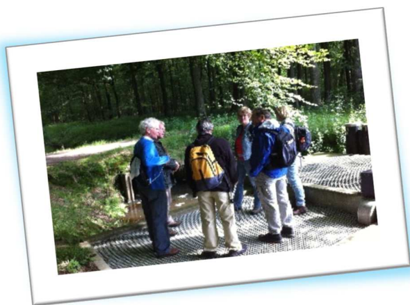
Er zijn al veel vispassages gerealiseerd, maar nog niet overal kunnen vissen ongehinderd de stuwen en sluizen in Groot Salland passeren.