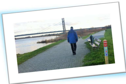
Op de dijken moeten wandelroutes mogelijk zijn.