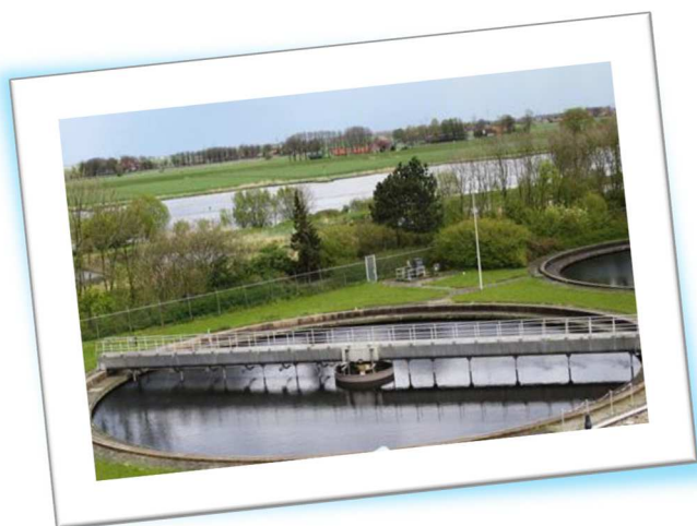
De zuiveringsinstallatie in Kampen is een mooi voorbeeld hoe energieneutraal kan worden gewerkt.